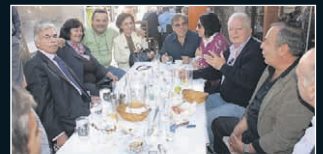
Η υπό ίδρυση παράταξη «Αυτόνομη Ριζοσπαστική Κίνηση Αχαρνών»...