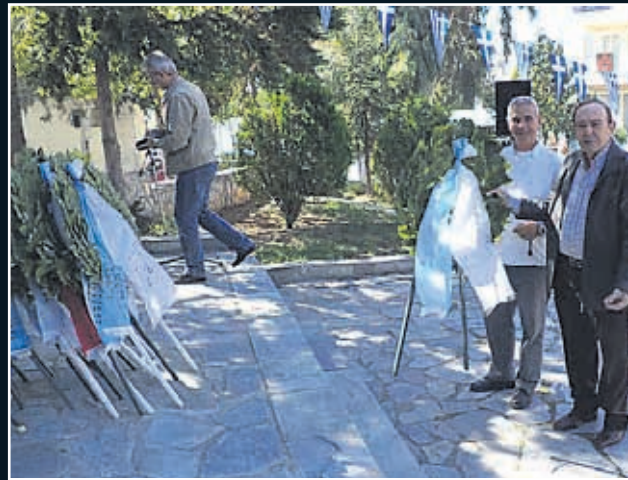
Αφού τελείωσε η επίσημη τελετή επιμνημόσυνης δέησης και κατάθεσης στεφάνων δύο γείτονες που όλο το χρόνο προσέχουν τον χώρο του Μνημείου Ηρώων κατέθεσαν ένα από τα στεφάνια που περισσεύσαν προς τιμήν της επετείου και της πόλης!