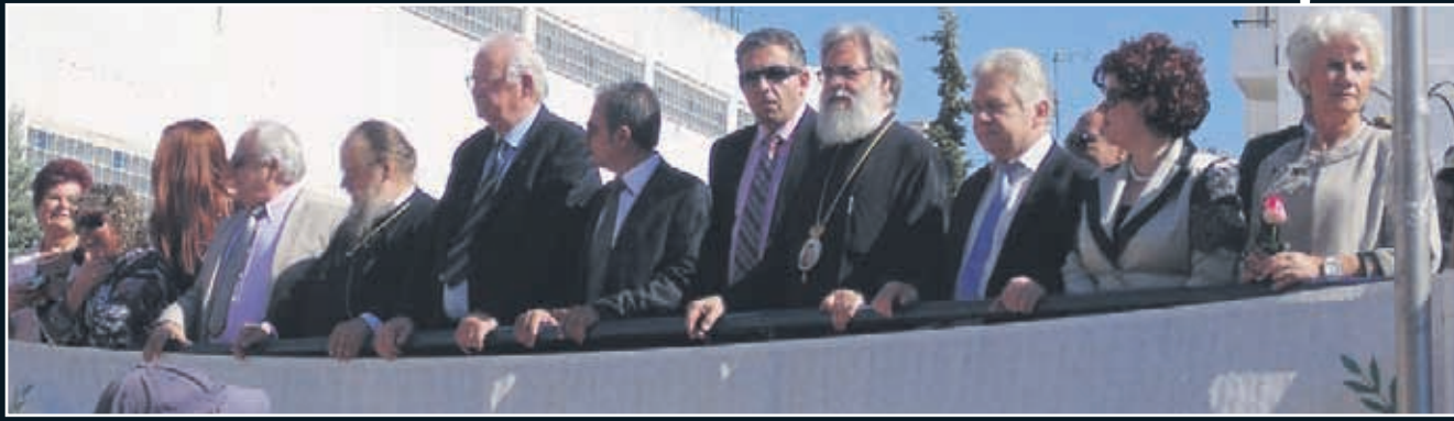
Μετρημένοι στα δάχτυλα οι πραγματικοί επίσημοι στην εξέδρα που στήθηκε για την μαθητική παρέλαση...