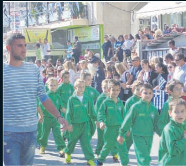
Άραγε οι... σκάουτερ ήταν κρυμμένοι στα μπαλκόνια της οδού Φιλαδελφείας ή είχαν ρεπό λόγω αργίας;