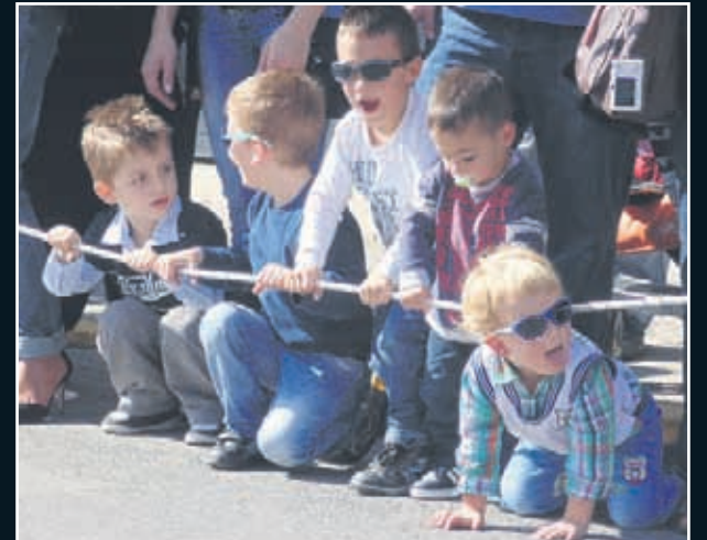
Οι μπόμπιρες μπορεί να μην παρήλθαν, αλλά έκλεψαν την παράσταση!