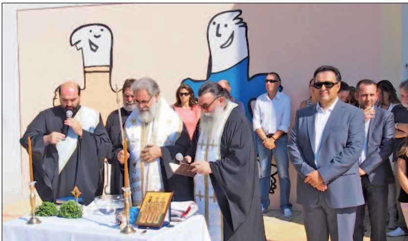
Άπό τόν Άγισμό στό 1ο Δημοτικό Σχολείο Όλυμπιακού Χωριού

Επίσης οι κύριοι Κασσαβός καί Κατσιγιάννης συναντήθηκαν μέ τούς υπευθύνους του ΟΑΣΑ καί έλαβαν διαβεβαιώσεις ότι θα εφαρμοστεί τό ενιαίο εισιτήριο από Δεκέλεια καί Αχαρνές (ισχύει τώρα από ΣΚΑ).