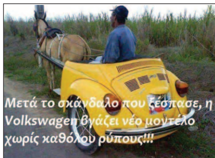
Μετά το σκάνδαλο που ζέσπασε, η Volkswagen βγάξει νέο μοντέλο χωρίς καθόλου ρύπους!!!

Πωλούνται λικέρ σπιτικά και ρακόμελο Κρήτης Τηλ. 6934696122