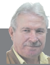
Από τον Διευθυντή της έκδοσης ΓΙΩΡΓΟ ΝΙΩΡΑ