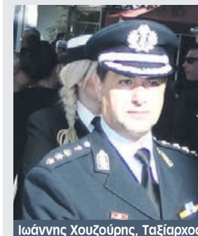
Ιωάννης Χουζούρης, Ταξίαρχος

Με τις πρόσφατες κρίσεις στην Αστυνομία επήλθαν σημαντικές αλλαγές και μετακινήσεις στις νευραλγικές θέσεις