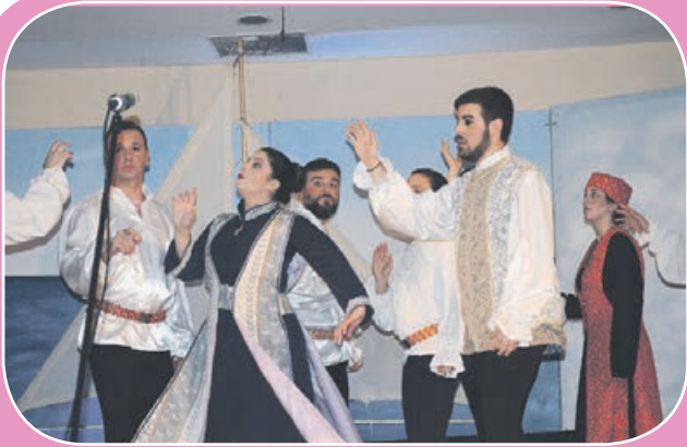
Ξεπέρασαν κάθε προσδοκία, το Παράρτημα Αχαρνών της Ελληνικής Αντικαρκινικής Εταιρείας και η νεανική σκηνή «Ονειροβάτες» οι οποίοι παρουσίασαν την Κυριακή 20 Μαρτίου στο Δημαρχείο Αχαρνών,