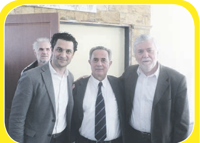
Παρουσίαση του βιβλίου: «Το Ποντιακό Ζήτημα και η 19η Μαΐου στην Ελλάδα και την Τουρκία» πραγματοποιήθηκε στην Αίθουσα Εκδηλώσεων «ΓΕΩΡΓΙΟΣ ΜΩΥΣΙΑΔΗΣ» με ομιλητή τον Κωνσταντίνο Φωτιάδη - Ομότιμο Καθηγητή Πανεπιστημίου Δυτ. Μακεδονίας την Κυριακή 20 Μαρτίου 2016. Την εκδήλωση συνδιοργάνωσε ο Δήμος Αχαρνών με την Εύξεινο Λέσχη Αχαρνών & Αττικής «Ο Καπετάν Ευκλείδης»

Το Δ.Σ. ευχαρίστησε τα μέλη και τους φίλους του Συλλόγου που ανταποκρίθηκαν στο κάλεσμα τους για λίγα μόλις λεπτά από τον πολύτιμο χρόνο μας, που μπορούν να σώσουν περισσότερους από έναν ανθρώπους που βρίσκονται σε ανάγκη.