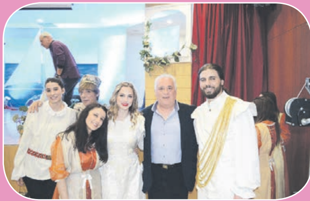
την μυθιστορία του Βιτσέντζου Κορνάρου «Ερωτόκριτος». Η προσέλευση του κόσμου ήταν τόσο μεγάλη με αποτέλεσμα η αίθουσα εκδηλώσεων του Δήμου Αχαρνών να μη μπορεί να ανταποκριθεί στις ανάγκες