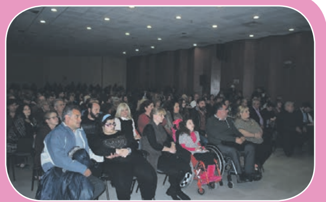
του κοινού. Πολλοί ήταν εκείνοι που παρακολούθησαν την παράσταση όρθιοι, παρόλο που μεταφέρθηκαν και τα καθίσματα της αίθουσας του Δημοτικού Συμβουλίου, αλλιά και από το Σύλλογο Κρητών.