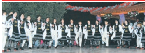
Η παιδική χορευτική ομάδα του Λύκειου Ελληνίδων Ιωαννίνων σε παράσταση στη Σμύρνη