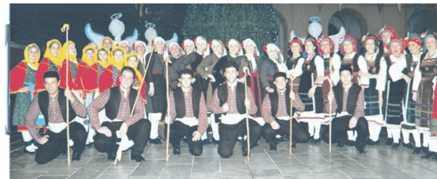
Το Χορευτικό δυναμικό του Λυκείου των Ελληνίδων, στη Κεντρική Πλατεία των Αχαρνών