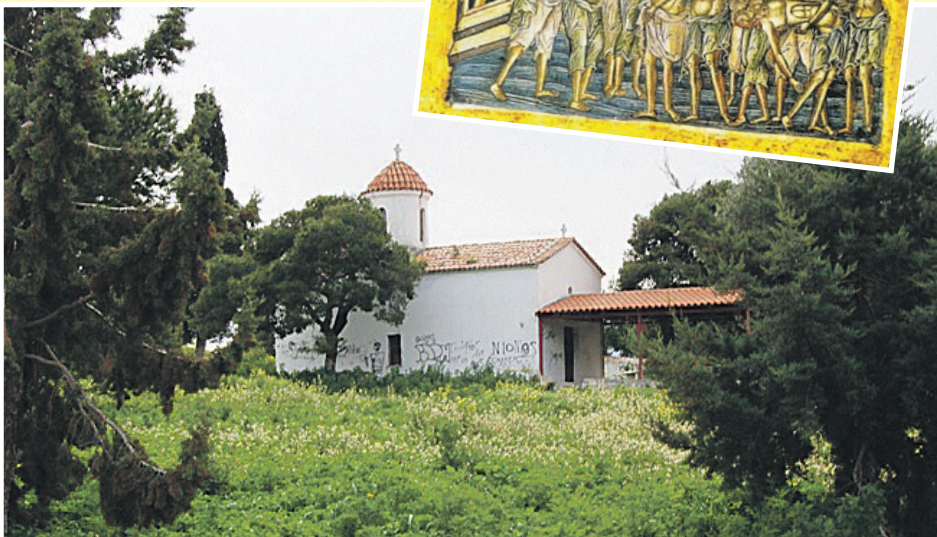
Διεύθυνσις: Λόφος Σαράντα Μαρτύρων Αχαρνών