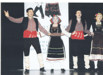
Στα 30 χρόνια του Παραρτήματος Αχαρνών

Συναυλία στο Δημαρχείο Αχαρνών αθήλα και συμμετοχή μελών της σε σύμπραξη με τον Πολιτιστικό Σύλλογο Νίκαιας σε Διεθνές Φεστιβάλ Χορωδιών στις Σέρρες.