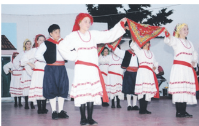
Η παιδική Χορευτική ομάδα του Λυκείου των Ελληνίδων Αχαρνών