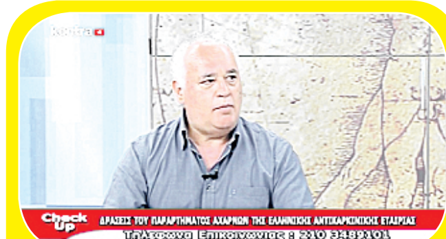
Check Up ΔΡΑΣΕΙΣ ΤΟΥ ΠΑΡΑΡΤΗΜΑΤΟΣ ΑΧΑΡΝΩΝ ΤΗΣ ΕΛΛΗΝΙΚΗΣ ΑΝΤΙΚΑΡΚΙΝΙΚΗΣ ΕΤΑΙΡΕΙΑΣ Τηλεφωνικά | Επιχειρησιακές & Ξύλο | ΕΛΛΗΝΙΚΗ

Ο γιατρός και πρόεδρος του Παραρτήματος Αχαρνών της Ελληνικής Αντικαρκινικής Εταιρείας, το Σάββατο, 25 Ιουνίου ήταν προσκεκλημένος στο kontra channel και την εκπομπή check-up με τον Ηλία Αθεξάκη.