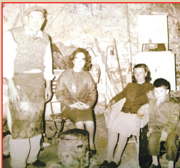
Η οικογένεια Νερούτσου